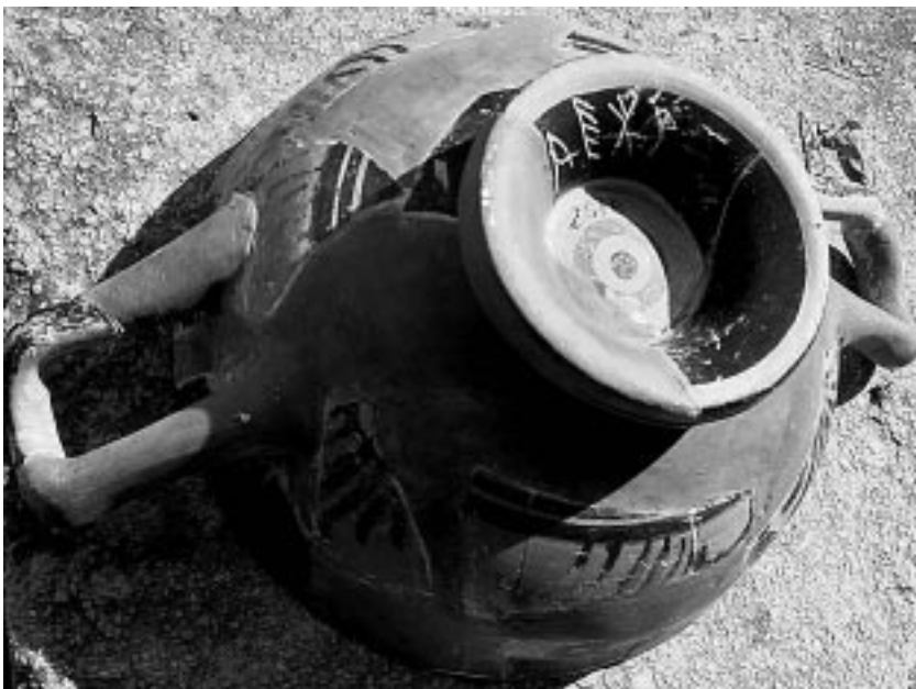
Figura 2. MLH III C2.30 (Museu d'Arqueologia de Catalunya – Ullastret).